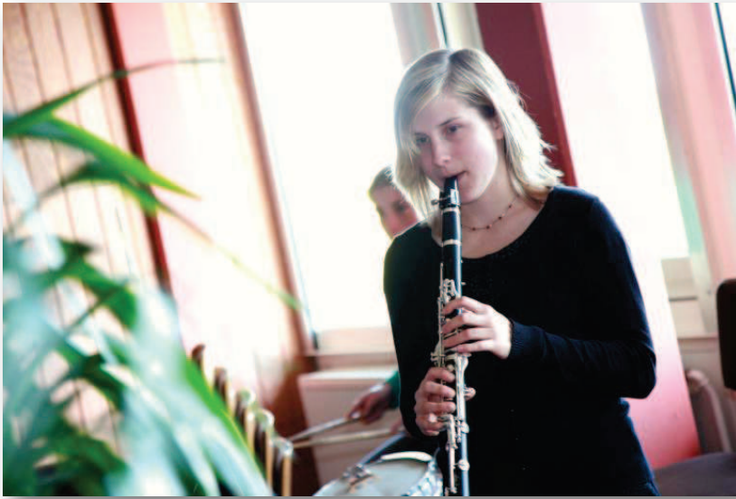
Beschriebene Musik ist halt wie ein erzähltes Mittagessen. Franz Grillparzer